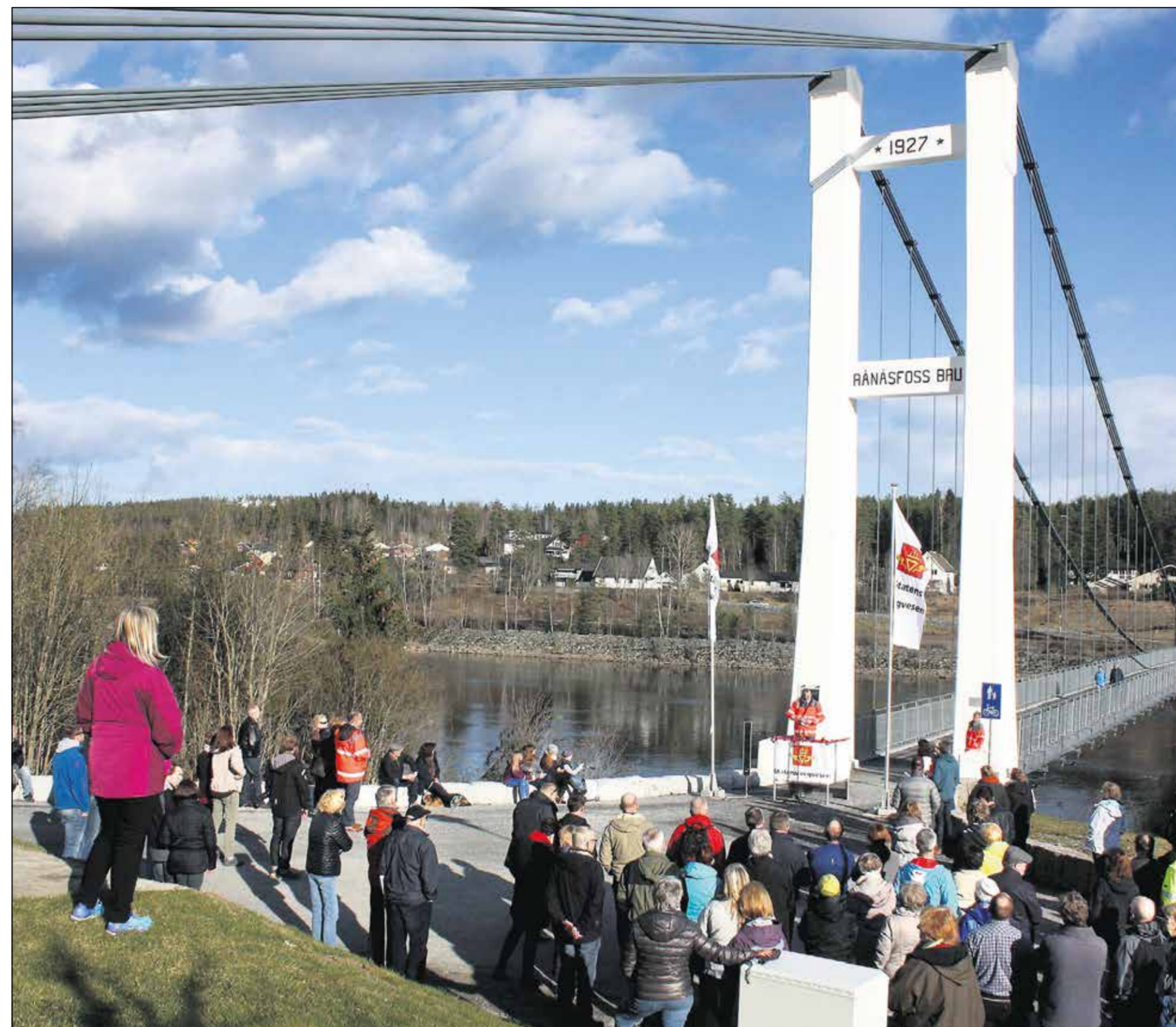
GJENÅPNING: Stor oppslutning om gårsdagens offisielle gjenåpning av Rånåsfoss bru.

Rånåsfoss bru er en av de første myke hengebruene i Norge fra 1927. Den er tegnet av Olaf