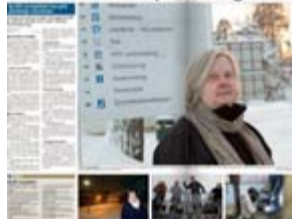
RB: Mandag 23. januar 2012.

Skolesektoren er Ullensaker kommunes lille sparegris