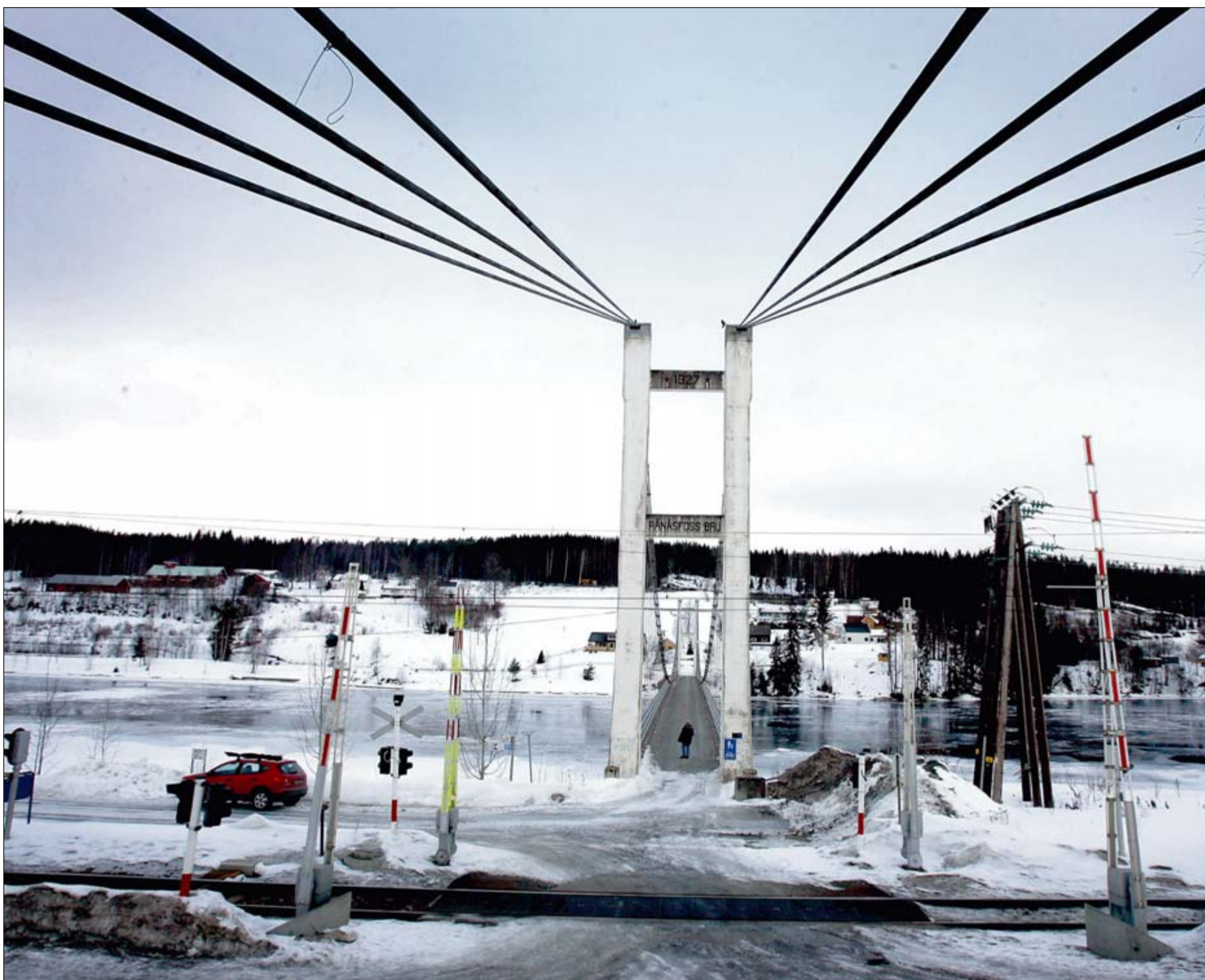
UVISS SKJEBNE: Siden 2002 har Rånåsfoss bru i Sørums kommun stått oppført i en nasjonal verneplan for veier og bruer der den anbefales fredet, men siden da har lite skjedd. I mellomtiden har brua pådratt seg et vedlikeholdsetterslep på 10 millioner kroner. Foreløpig er det ikke tatt en beslutning om hva som skal skje med brua. Nå står den i fare for å bli stengt.