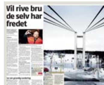
SJELDEN BRU: Romerikes Blad 21. januar 2012.